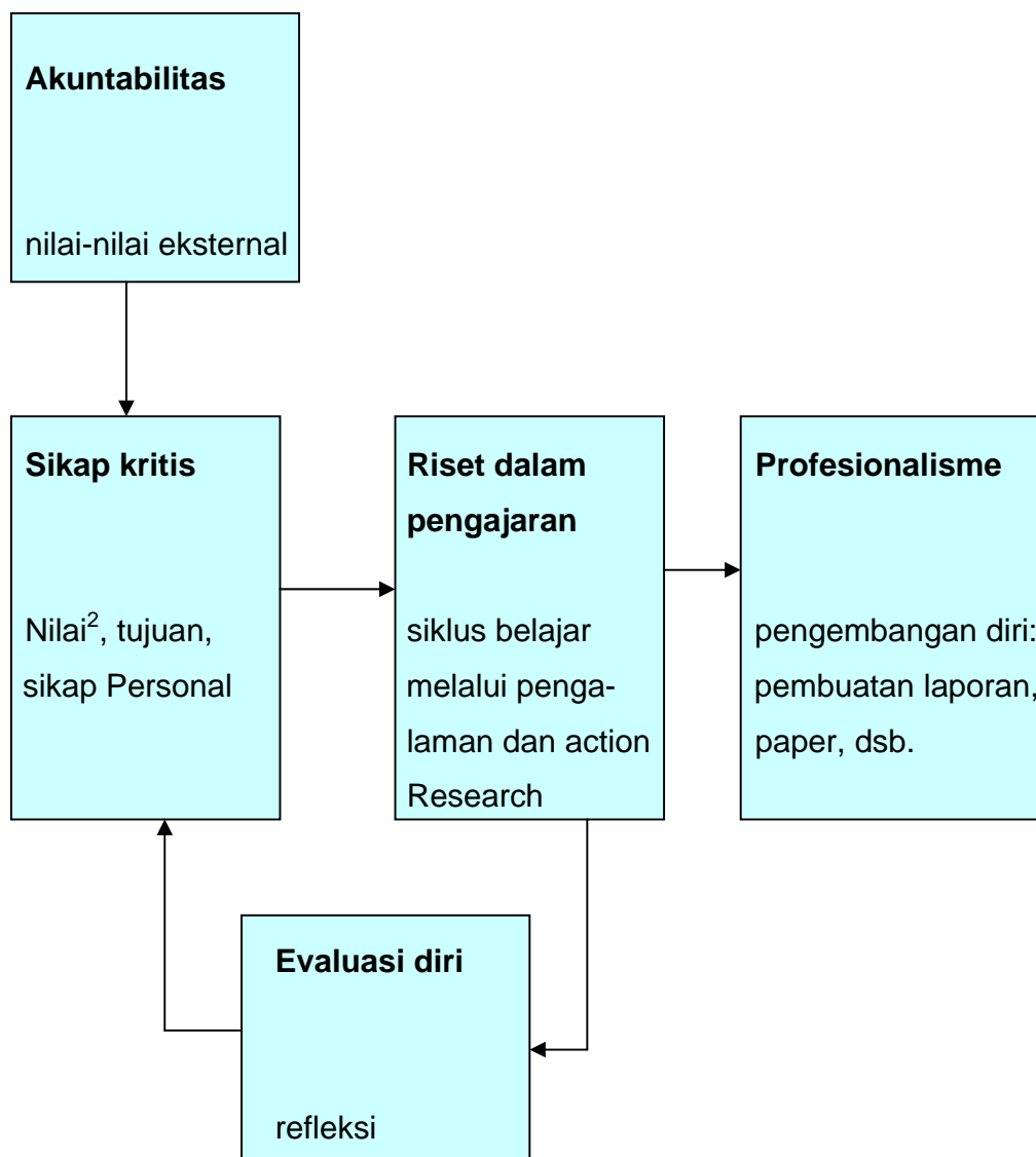
Gb. 3 Model CRASP dan pola action research (Zuber-Skerritt, 1992).

Model CRASP tersebut dapat dijelaskan dalam bentuk constructive dan reconstructive dengan empat momen dalam siklus action research. Tahap constructive yang meliputi planning (perencanaan) dan acting (tindakan) dikembangkan dari :